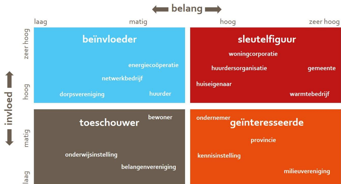
Figuur: schematische stakeholdersanalyse

De definitie van impact is: de mate van impact die een stakeholder heeft op het slagen van de warmtetransitie.